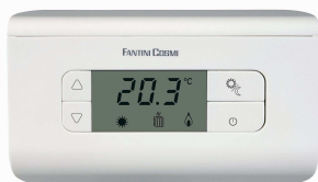
THERMOSTAT RADIO TH 115RF